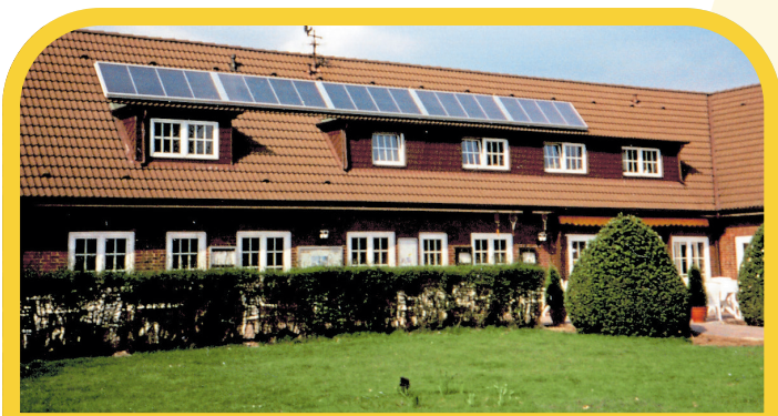
1999: Die Firma VEH plant und liefert die thermische Solaranlage des Eimsbütteler Turnvereins (ETV), Gewinner des Hamburger Solarpreises