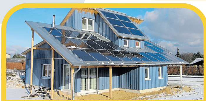
2007: Bundeswettbewerb gewonnen. Das Solarkonzept des Todtglüstringer Plus-Energie-Hauses gewinnt den ersten Platz für Deutschlands schönste Solaranlage (Initiator: Schüco)