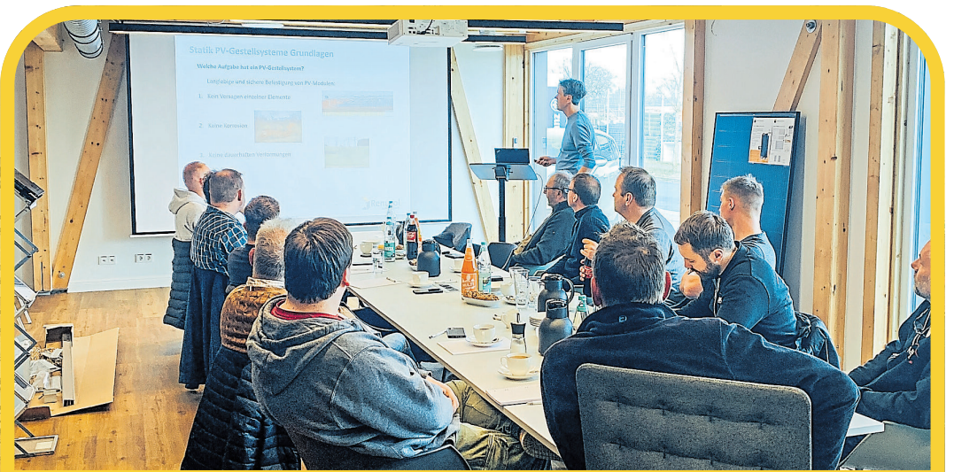
Der Seminarraum wird für Schulungen genutzt

Die Geschäftsidee, nicht nur Ware als klassischer Händler zu vertreiben, sondern zusätzlich die technische Unterstützung bei Planung, Auslegung, Inbetriebnahme und auch den Service anzubieten, erwies sich schnell als ein Erfolgsmodell. Mit der über 27-jährigen Erfahrung ist die VEH Solar- und Energiesysteme ein geschätzter und marktbestimmender Partner des Handwerks