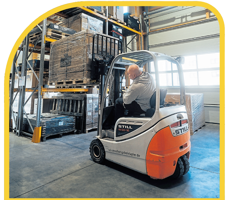
Auch das Lager bietet den Mitarbeitern beste Übersicht

und Fachplaner geworden. „Der hervorragende Kontakt und Austausch mit den Geschäftskunden und Techniks Schulungen anbieten kann in einem großen Seminarraum erfolgen, in dem wir