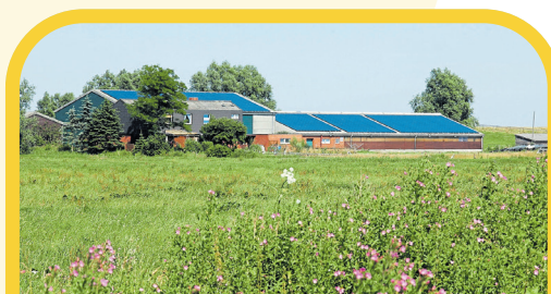
2005: Die erste große Solarstromanlage. Im Landkreis Stade entsteht die bis 2005 größte Solarstromanlage auf der Dachfläche eines landwirtschaftlichen Gebäudes.