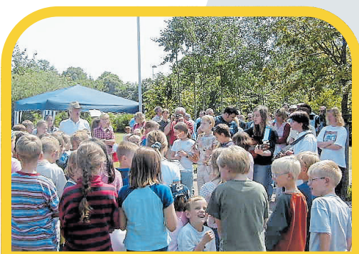
2004: Die Solarstromanlage auf dem Dach der Grundschule Wistedt wird feierlich eingeweiht