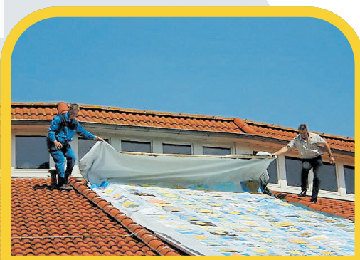
Juni 2004: Tostedt zeigt Kindern die Zukunft mit der Solarstromanlage auf der Grundschule in Wistedt