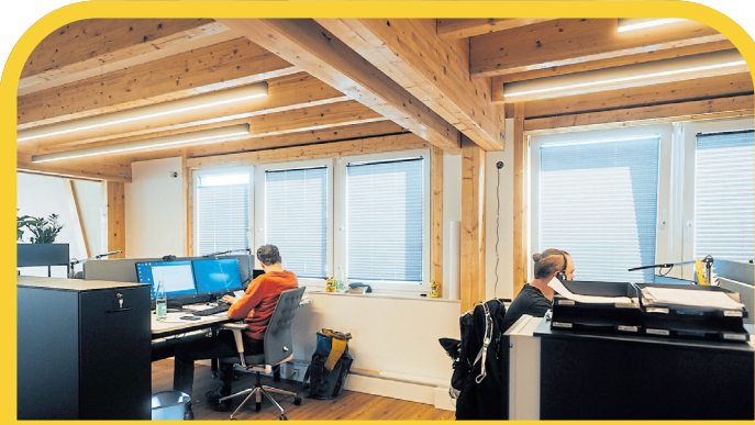
Das Großraumbüro vereinfacht die Kommunikation