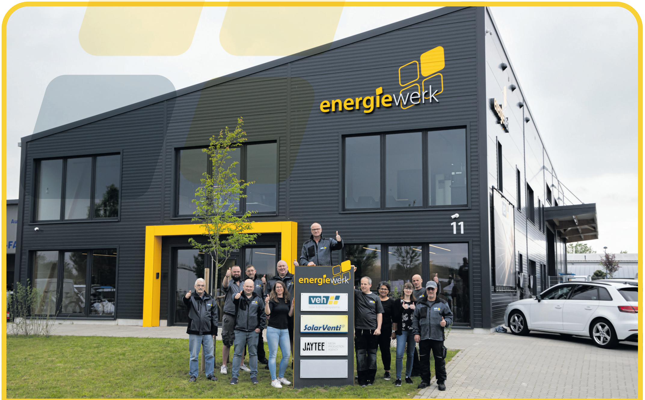
Das VEH-Team vor dem neuen Firmenstandort an der Friedrich-Vorwerk-Straße 11 in Tostedt. Ein Teil der Mitarbeiter fehlt auf dem Bild

VEH Solar- und Energiesysteme - neues Firmengebäude in Tostedt wurde in Betrieb genommen