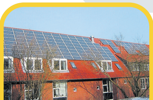
September 2005: Das Tostedter Rathaus wird Norddeutschlands erstes kommunale Gebäude, das sein Dach an Solarstrombetreiber verpachtet